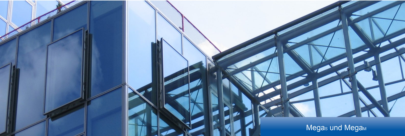
Mega S und Mega M