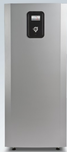
Mega L und Mega XL

Energieeffizienz Klasse A+++ wenn die Wärmepumpe Teil eines Verbundsystems ist Energieeffizienz Klasse A+++ wenn die Wärmepumpe alleiniger Wärmeerzeuger ist Energieeffizienz Klasse gemäß Eco-Design Richtlinie 811/2013